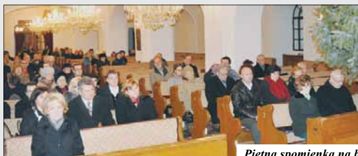
Pietna spomienka na bratov Štúrovcov, 13. 1. 2012.