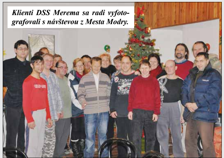
Klienti DSS Merema sa radi vyfotografovali s návštevou z Mesta Modry.