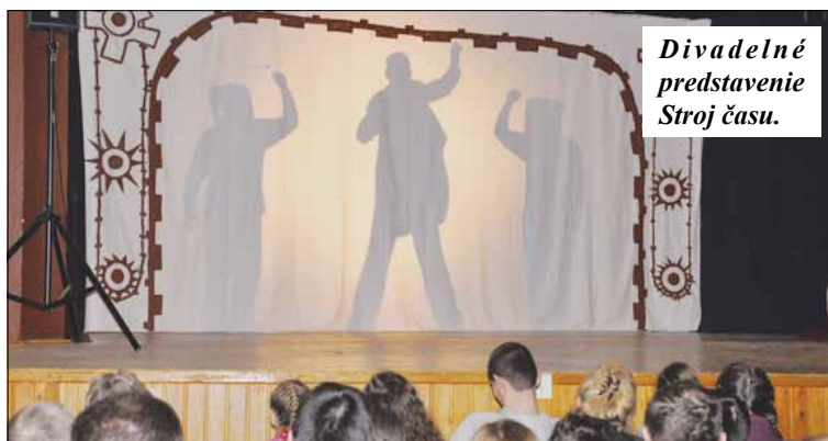
Divadelné predstavenie Stroj času.