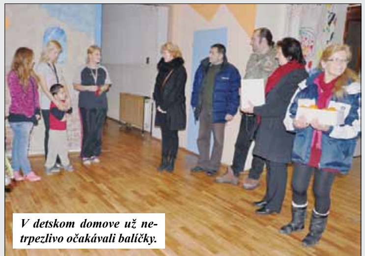
V detskom domove už netrpelivo očakávali balíčky.