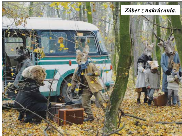
Záver z nakrúcania.