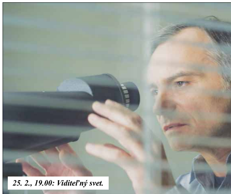
25. 2., 19.00: Viditeľný svet.

3. 2., 19.00 – pia Tri, romantický, Nemecko, 2010, 119 min., MN 15 4. 2., 19.00 – sob Strom života, dráma, USA, 2011 5. 2., 17.00 – ned Autorozprávky, animovaný, ČR, 2011, 87 min., MP 10. 2., 19.00 – pia Domov na Vianoce, tragikomédia, Nórsko, 2010, 82 min., MN 12 11. 2., 19.00 – sob Zoošetrovateľ, komédia, USA, 2011, 104 min., MN 12 12. 2., 19.00 – ned Mission: Impossible – Ghost Protocol, akčný, USA, 2011, 133 min., MN 15 17. 2., 19.00 – pia Vše pro dobro světa a Nošovic, dokument, ČR, 2010, 82 min., MP 18. 2., 19.00 – sob Polnoc v Paríži, komédia, Špan/USA, 2011, 94 min., MN 15 19. 2., 17.00 – ned Tintinové dobrodružstvá, rodinný, USA, 2011, 107 min., MP 24. 2., 19.00 – pia Skrytý pôvab buržoázie, satirický, Fra/Tal/Špan., 1972, MN 12 25. 2., 19.00 – sob Viditeľný svet, dráma, SR, 2011, 104 min., MN 12 26. 2., 19.00 – ned Paranormal Aktivity 3, horor, USA, 84 min., MN 15 (msks)