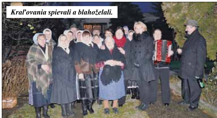
Kraľovania spievali a blahoželali.