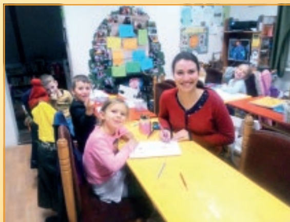
Naša bývalá študentka na návšteve na hodine.