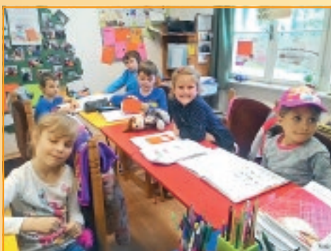
Na hodine a veselo.