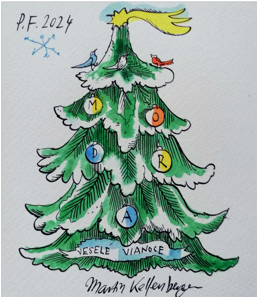
ILUSTRÁCIA: MARTIN KELLENBERGER

kvalitným vínom, keramikári vyočili a vymaľovali ruže na modranských džbánoch a oslávili neuveriteľných 140 rokov pri remese. Ľudovít Štúr, tak ako po iné roky, pozdravil okoloidúcich